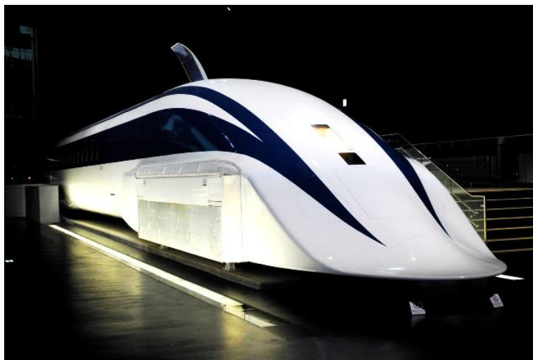
Prototype du SCMaglev japonais détenteur du record du monde de vitesse (581 km/h).

A l'heure actuelle, 3 lignes commerciales ont déjà été ouvertes pour le public : le Transrapid à Shanghai, le Linimo à Aichi (Japon) et l'UTM-02 à Daejeon (Corée du Sud). Par ailleurs, de nombreuses pistes d'essai ont été construites à travers le monde. Une des plus notables est celle empruntée par le SCMaglev au Japon, un train utilisant des aimants supraconducteurs. Ce véhicule a porté le record du monde de vitesse pour un train à 581 km/h et sera utilisé pour relier Tokyo à Nagoya d'ici 2025.